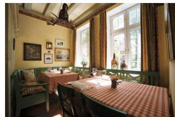
Ole Liese Wirtschaft